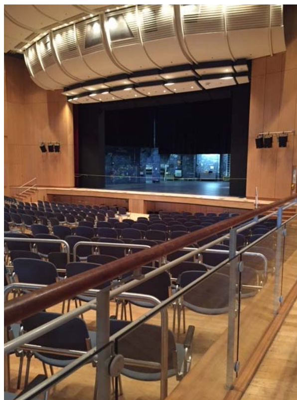
(Blick von der rechten Seite)