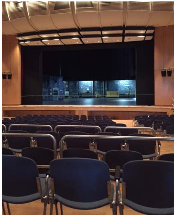
(Blick von Reihe 17 rechts)