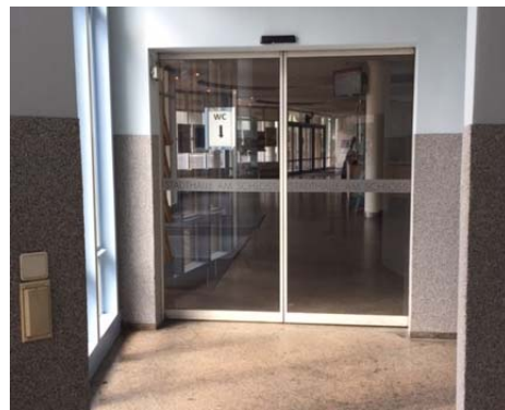
(Automatiktür in die Stadthalle)