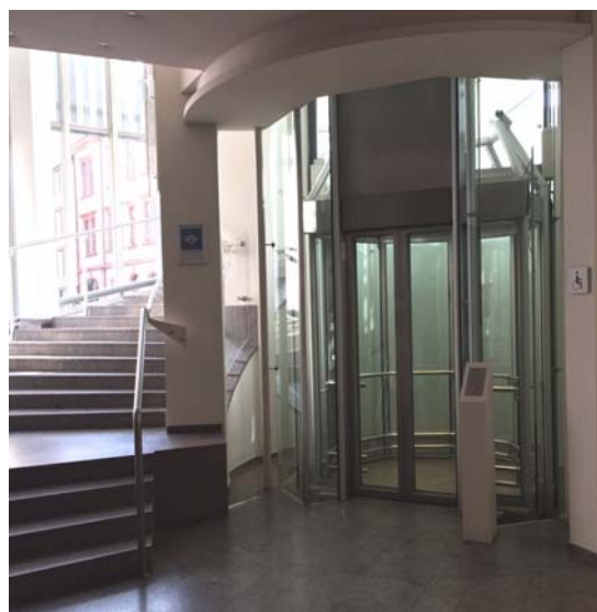
(Aufzug zum Kirchner Saal)