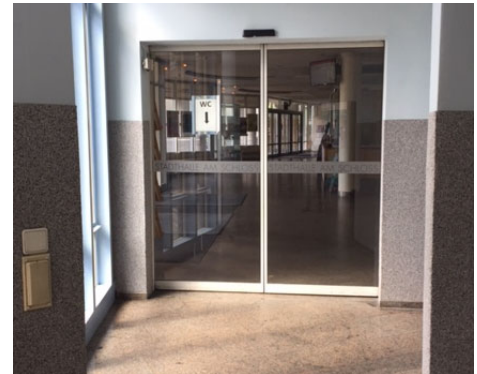
(Automattür in die Stadthalle)