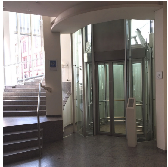
(Aufzug zum Kirchner Saal)