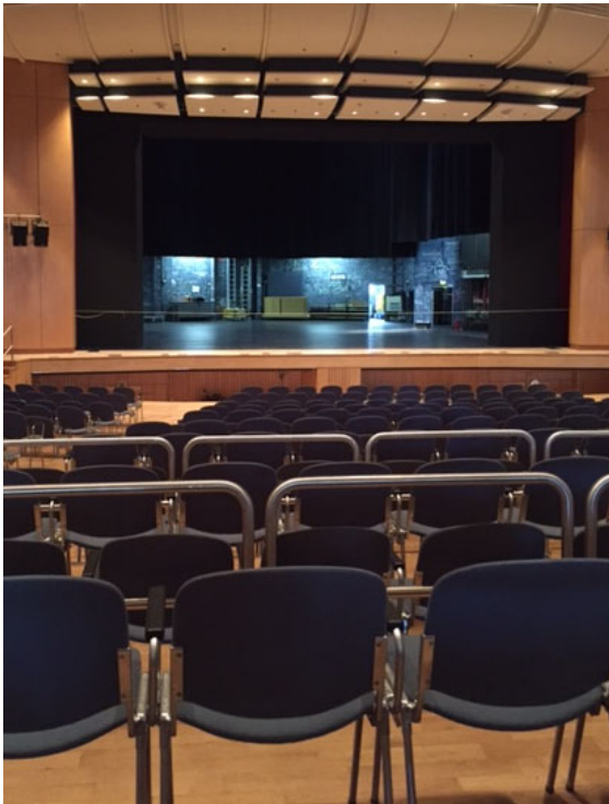
(Blick von Reihe 17 links)